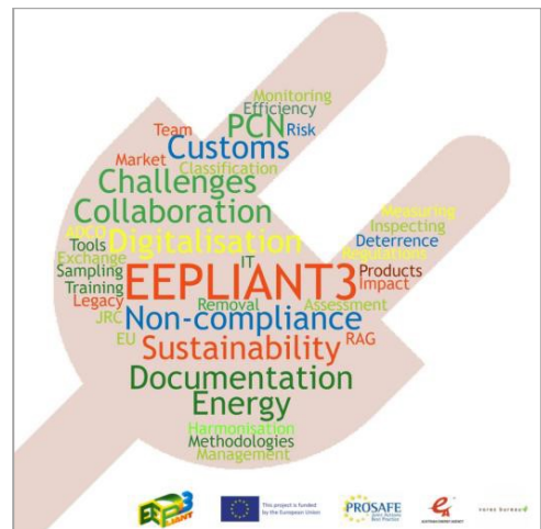
Bild 2 - Wortwolke basierend auf den wichtigsten Kommentaren der MT-Sitzung

Vertreter der Europäischen Kommission nahmen an beiden Veranstaltungen teil und gaben wertvolle Hinweise und Ratschläge.